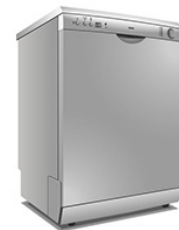
Un lave vaisselle