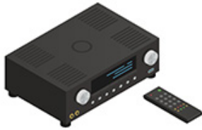
Un ampli hi-fi