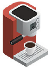
Une machine à café