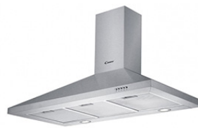
Une hotte aspirante