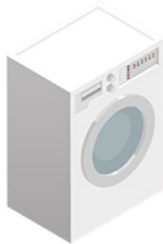
Une machine à laver Un lave-linge