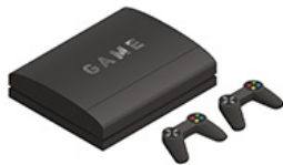
Une console (de jeux vidéo)