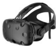
Un casque VR (réalité virtuelle)