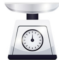
Une balance de cuisine