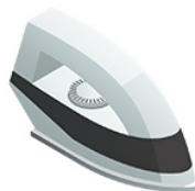
Un fer à repasser