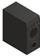
Un caisson de basse