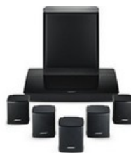
Un home cinéma