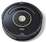
Un robot aspirateur