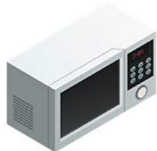
Un four à micro-ondes