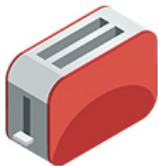
Un grille-pain Un toaster