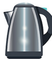
Une bouilloire électrique