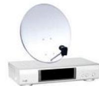
Un décodeur satellite