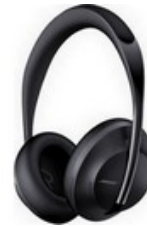
Un casque audio