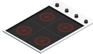
Des plaques de cuisson