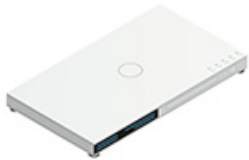
Un lecteur Blu-ray